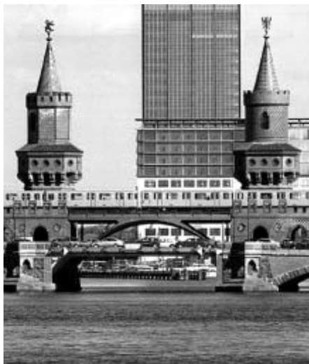
Oberbaumbrücke: Am Denkmaltag ist auch der Brückenraum offen