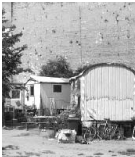
Revaler-/Ecke Modersohnstraße: Was wird gebraucht im Kiez?