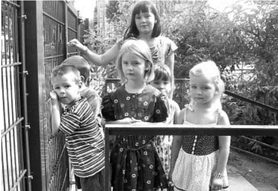
Jetzt kann's wieder rund gehen: Die Kita in der Simplonstraße wurde generalüberholt