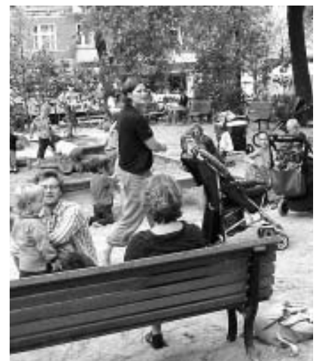
Zufriedene Gesichter: Jung und Alt feierten auf dem Boxhagener Platz

Ab Oktober bekommen Spaziergänger im Kiez wieder etwas zu sehen: eine Neuaufgabe des Boxhagener Fensters. In herbstlichem Orange informieren die zehn verschiedenen Schautafeln dieses Mal über Initiativen und Vereine im Kiez. Begleitend zu den großen Plakaten liegt unter anderem im Quartiersbüro der Flyer mit den Standorten des Boxhagener Fensters aus.