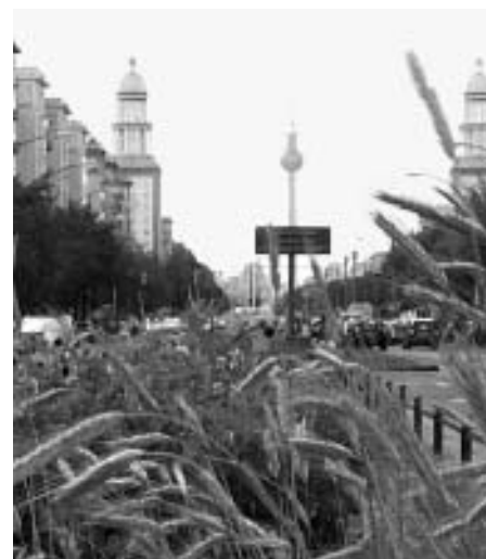
Nutzpflanzen statt Blumenrabatten: Was auf der Frankfurter Allee wächst, kann man essen

Langsam fahren lohnt sich auf der Frankfurter Allee. Denn der Mittelstreifen der vierspurigen Straße bietet derzeit einen überraschenden Anblick: Zwischen Proskauer und Pettenkofer Straße gedeihen Kulturpflanzen aus Brandenburg. „Brandenburg in Berlin-Friedrichshain“ heißt das Projekt des Vereins Frankfurter Allee in Kooperation mit der BUF (Bildungseinrichtung für berufliche Umschulung und Fortbildung). Auf gut 100 Kreisen mit einem Durchmesser von drei bis fünf Metern wachsen typische brandenburgische Nutzpflanzen: Gräser, Getreide und Gemüse wie Mangold, Kartoffeln, Weizen, Gerste, Hafer, Mais, Rüben, Rhabarber und Hanf. Das Projekt erinnert an die lange Tradition der Landwirtschaft im Kiez: Schon um 1300 soll es in der Gegend ein Einzelgehöft gegeben haben. Deshalb ersetzte man in diesem Sommer die sonst üblichen Blumenrabatten durch die alten Kulturpflanzen. Das Projekt wird unterstützt durch das Programm „Soziale Stadt“ und durch den Europäischen Fonds für regionale Entwicklung.