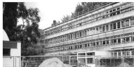
Die Modersohn Grundschule während der Sanierung

Mit Hilfe erheblicher finanzieller Mittel aus dem Förderprogramm Soziale Stadt ist es dem Quartiersmanagement in Zusammenarbeit mit den Fördervereinen der Schulen, den Trägern und dem Bezirksamt möglich, dringend erforderliche Instandsetzungs-, Sanierungs- und Erweiterungsmaßnahmen zu finanzieren.