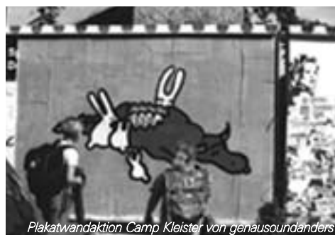
Plakatwandaktion Camp Kleister von genaoundanders

Vom 6. Oktober bis 1. November findet Ihr den Spielwagen immer Freitags auf dem Boxi. web: www.spielwagen1035.de