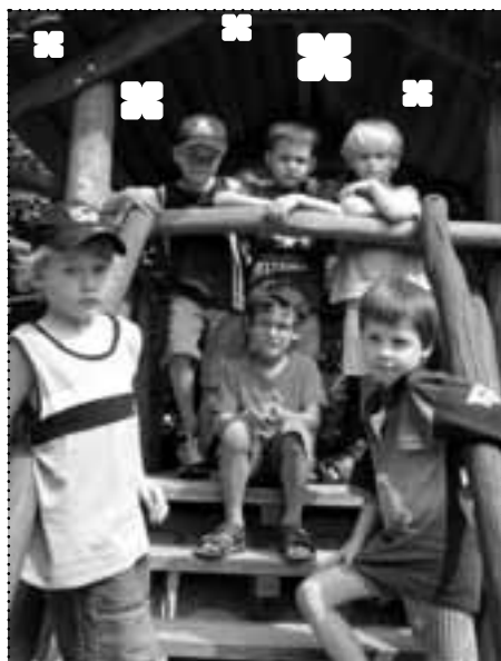
Über ihre sanierte Kita können sich die Kinder in der Simplonstraße freuen

→ Kita Simplonstraße hofft auf weitere Sanierungsmittel