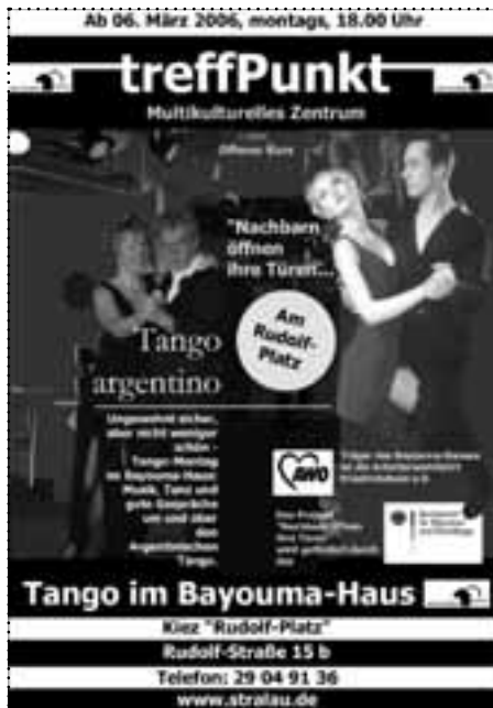
Auch beim Tango können sich die Nachbarn im Bayouma-Haus jetzt näher kommen