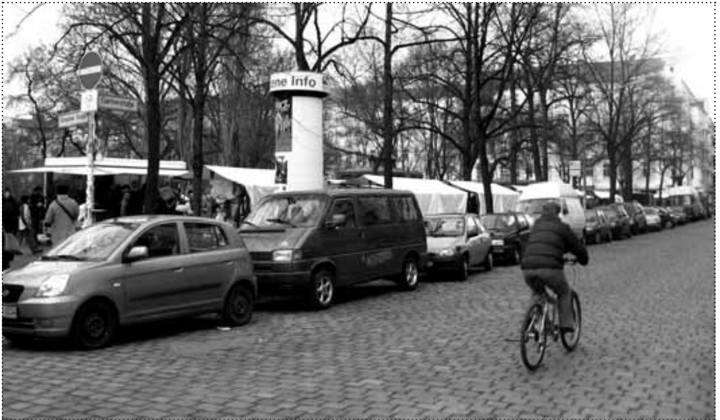
Radfahrer dürfen die Gärtnerstraße und Mainzer Straße in nördlicher Richtung befahren – Autofahrer seit vergangenem Sommer nicht mehr