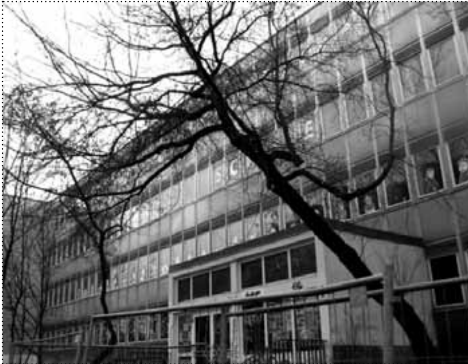
Kinderreicher Kiez – die Zille-Grundschule wird in den kommenden Jahren noch mehr Schüler aufnehmen müssen

Insgesamt verzeichnet Berlin einen leichten aber stetigen Rückgang seiner Einwohnerzahl. Nicht so am Boxhagener Platz. Dort war in den vergangenen Jahren eine stetige Zunahme der Bevölkerung zu verzeichnen. Eine Bevölkerung, die gleichzeitig auch immer jünger wird. Denn auch das sagen die Zahlen des Statistischen Landesamtes: Der Boxhagener Platz ist, ebenso wie das