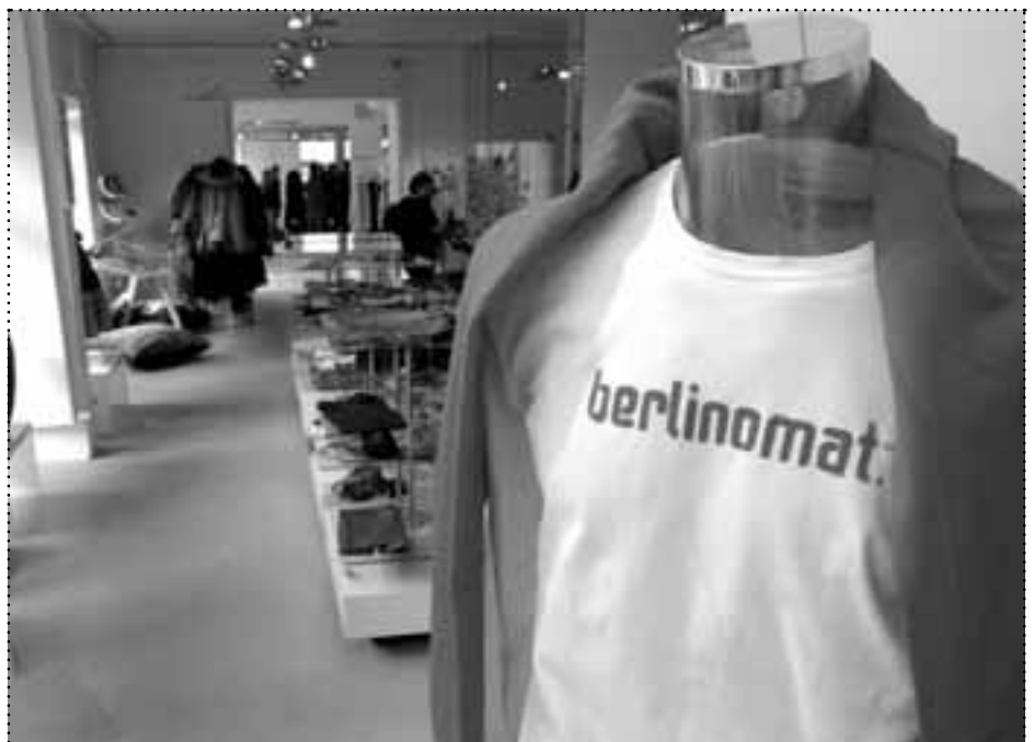
Nach der Einweihung eines weiteren Showrooms beträgt die Ausstellungs- und Verkaufsfläche im berlinomat jetzt insgesamt 450 Quadratmeter

Unterstützung erhält er dabei von der Senatsverwaltung für Wirtschaft. Das berlinomat ist Montag bis Freitag von 11 bis 20, Sonnabend von 10 bis 18 Uhr geöffnet. Außerdem können die Produkte im Internet angeschaut werden unter: www.berlinomat-shop.com . ☒