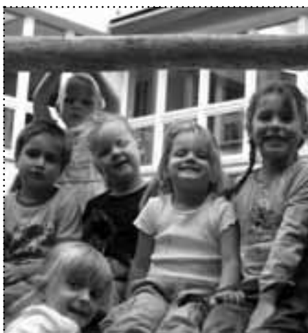
Mehr Kinder im Kiez bedeutet auch mehr Zuwachs in den Kitas

Die Kindertagesstätten in der Gryphiusstraße 34 werden ab Oktober dieses Jahres umfangreich saniert. Unter anderem gibt es neue Sanitäreinrichtungen und Elektro-Installationen. Während des Baubetriebs werden die Kitas geschlossen. Die Kinder werden ab September in Räume in der Kleinen Markusstraße und Strausberger Straße umziehen. Die Arbeiten werden voraussichtlich bis Sommer kommenden Jahres dauern. ☒