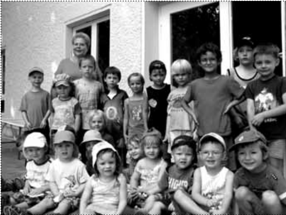
Seit 2003 wurde das Gebäude der Kita in der Simplonstraße über insgesamt vier Bauabschnitte modernisiert. Knapp 200 Kinder werden von den Mitarbeiterinnen betreut.

weitere Kita einrichten. „Wir überlegen derzeit zusammen mit den Trägern, wo es noch zusätzliche Räumlichkeiten für die Kinderbetreuung gibt“, sagt Jugendamtsplanerin Ute Fißler. „Zum Beispiel auch in Gebäuden,