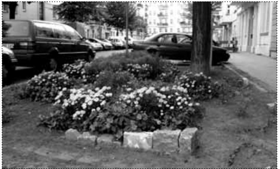
Schmucke Blumenbeete wie hier wird es im kommenden Jahr wohl nicht mehr geben. Das Projekt Grüne Baumscheiben blühte nur einen Sommer.

Die mobile Spiel-Einrichtung für Jugendliche erhielt 3.400 Euro. Mit dem Geld wurden neue Spielgeräte angeschafft. „Auch im kommenden Jahr will der Spielwagen seine Vor-Ort-Angebote auf dem Boxhagener Platz (jeweils freitags) und am Traveplatz (jeden Dienstag) fortsetzen. Der Verein kämpft weiter um mehr Geld – vor allem für zusätzliches Personal.“ ☒