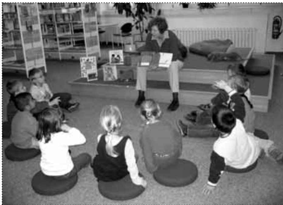
Beliebt und nachhaltig: Das Projekt „Kinder werden WortStark“

Nachhaltigkeit wird es auch bei den „Boxi-Bären“ geben. Seit 2006 gibt es unter dem Dach von Karuna e.V. dieses Projekt einer aufsuchenden Sozialarbeit auf dem Boxhagener Platz. Zwei Streetworker sind dort