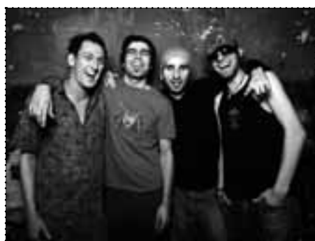
Die Ohrbooten machen oft Straßenmusik am Boxi

Gerade in den vergangenen Jahren haben viele Schriftsteller Friedrichshain als literarischen Ort entdeckt. Friedrichshainer Musiker pressen ihre Songs auf CD. Eine Auswahl dieser Werke „Made in Friedrichshain“ findet sich jetzt auf der Webseite www.boxhagenerplatz.de unter der Rubrik