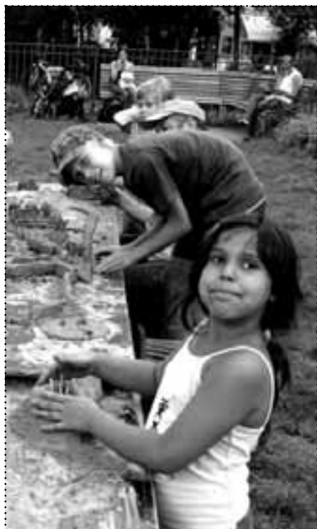
Spielepaß bietet u. a. der „Spielwagen e. V.“, der jeden Freitag auf dem Boxi halt macht

Am Sonnabend, den 22. September, findet auf dem Boxhagener Platz das diesjährige Familienfest statt. Der Schwerpunkt der Veranstaltung ist auch in diesem Jahr das „Thema Gesundheit und Bewegung“. Unter dem Motto „Auf den Platz und fertig los...“ gibt es von 15 bis 20 Uhr verschiedene Sportangebote, von Laufen über Karate bis Kleintorschießen. Auf der Bühne gibt es Breakdancer, Streetdancer und Hip Hopper des Jugendclubs Skandal sowie Tanz- und Gesangsgruppen aus den Kitas und Schulen der Umgebung zu sehen. Auf der Wiese laden der „Spielwagen“, der „Zirkus Zack“ und der Cassiopeia-Workshop zu Mitmachaktionen ein. Veranstalter ist die Arbeitsgemeinschaft des Sozialraum VIII, ein Netzwerk, zu dem verschiedene Kinder- und Jugendeinrichtungen, Schulen und Kitas, freie Träger und Initiativen sowie das Bezirksamt gehören. Die verschiedenen Institutionen und Projekte geben einen Überblick über Sportmöglichkeiten im Kiez und informieren über ihre Angebote. Die Familien im Quartier sollen auf diese Weise noch stärker für das Thema Gesundheit sensibilisiert werden. ☒