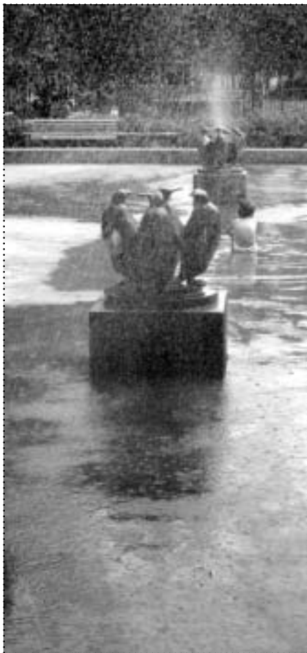
Schon vor mehr als 70 Jahren wurde die Plansche am Boxhagener Platz eingerichtet. Bis heute bietet sie Kindern eine kalte Dusche während der warmen Jahreszeit.

→ Wo sich die warmen Wochen am besten genießen lassen