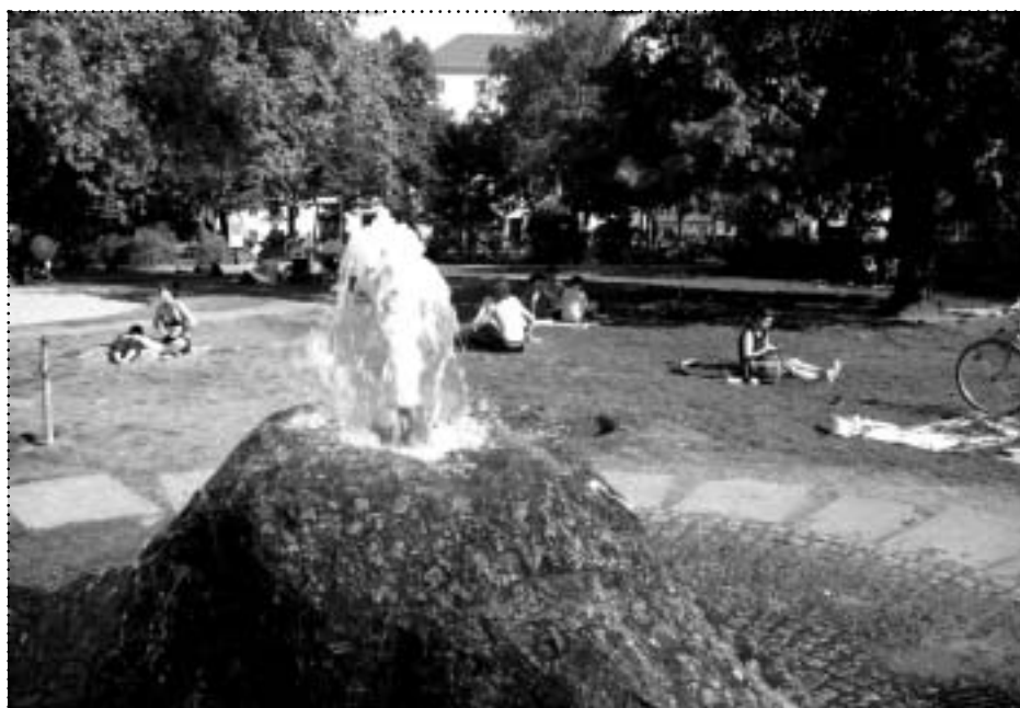
Der Traveplatz gilt als Treffpunkt für die Familien aus der Umgebung

Das alles passiert oft parallel, ohne dass jemand auf der einen Seite des Platzes mitbekommt, was an anderer Stelle gerade los ist, oder sich davon irritieren lässt. Und eines scheint bei allen Problemen zuletzt erreicht worden zu sein. Die Anwohner haben sich den Platz mehr und mehr zurück erobert. Bleibt zu hoffen, dass das auch in diesem Sommer so bleibt. ☒