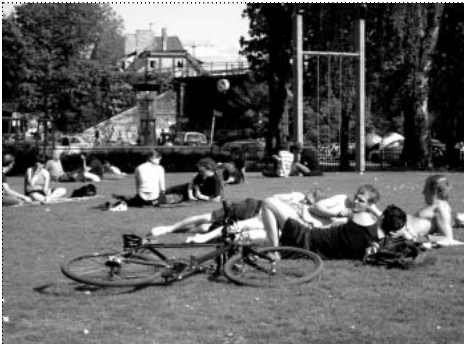
Erst vor einigen Tagen eröffnet und schon jetzt stark genutzt: Der Lenbachplatz

→ Parkanlagen gibt es nicht allzu viele im Quartier. Die sind dafür sehr gut frequentiert.