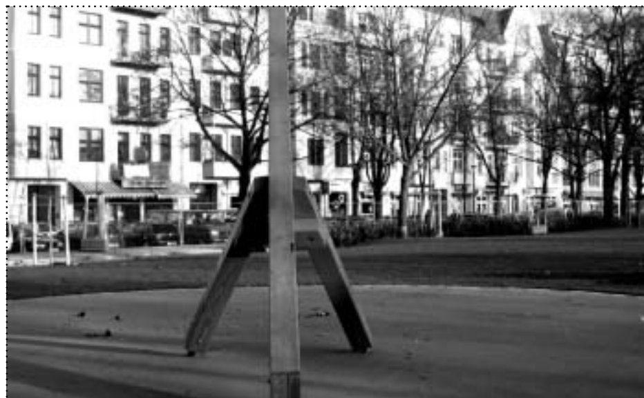
Grüne Oase vor der Ostkreuz-Baustelle. Der neu gestaltete Park an der Sonntag- und Lenbachstraße nimmt inzwischen Gestalt an. Derzeit ruhen die Arbeiten, sollen aber im Frühjahr weiter gehen.

Interessierte Existenzgründer (Gründung nach 2003) melden sich bitte bis zum 10. März per E-Mail unter web@boxhagenerplatz.de (Betreff „Online-Banner For Free“). Unter den Interessenten werden die fünf Teilnehmer ausgelost. ☒